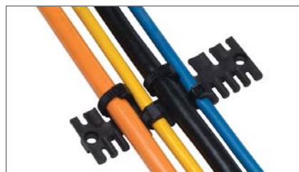
Učvršćivanje i usmjeravanje vodiča