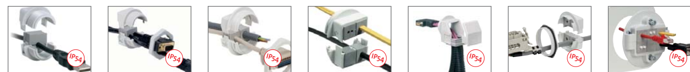
KVT 20 | KVT 25