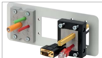
Dodaci za ormariće Ploče, prirubnice i pribor