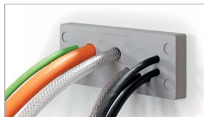
Uvodnice za kablove bez konektora